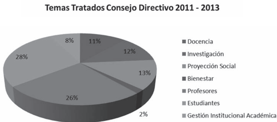
Figura 2. Temas tratados Consejo Directivo 2011 - 2013 2

Fuente: Actas Consejo Directivo Años 2011 - 2013, Junio de 2014.