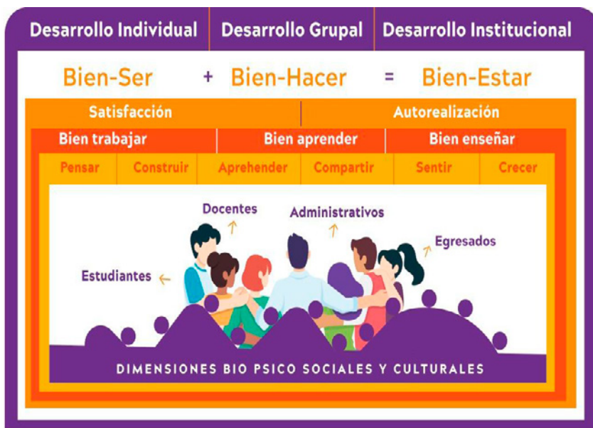
Figura 1. Concepto de Bienestar para la Universidad El Bosque.