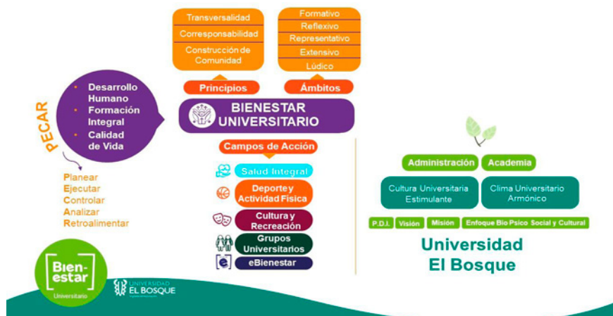
Figura 2. Modelo de Gestión de Bienestar Universitario en la Universidad El Bosque.